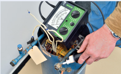
Prüfung von Isolationswiderstand...

Unsere Wartungen ermöglichen nicht nur einen werterhaltenden Betrieb sondern sorgen auch für die hohe Verfügbarkeit Ihrer Gasversorgung. Darüber hinaus besteht eine gesetzliche Verpflichtung zur regelmäßigen Überprüfung Ihrer Gasanlagen. Egal ob es sich um Verdampferanlagen, Tanks und Fülleinrichtungen handelt: wir sind Ihr kompetenter Ansprechpartner für alle Flüssiggasverbrauchsanlagen.